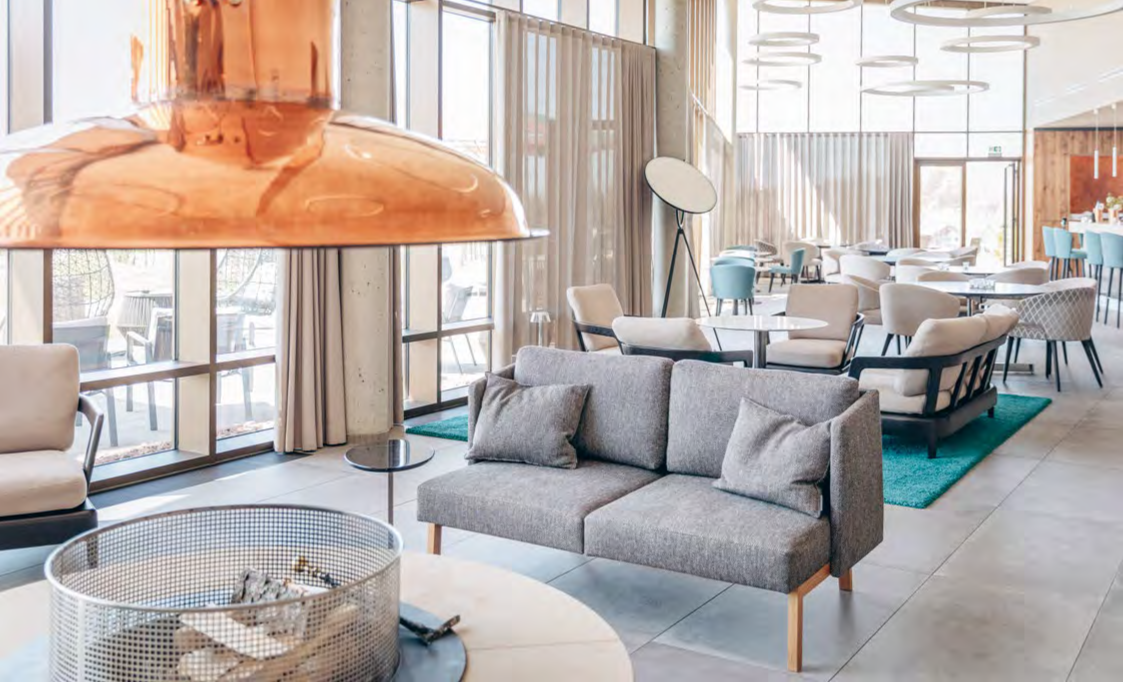
Objektausstattung: Golfclub Herzogswalde