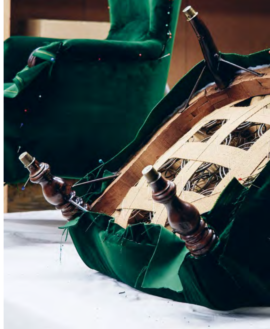
Unser handwerkliches Portfolio: Die Polsterwerkstatt